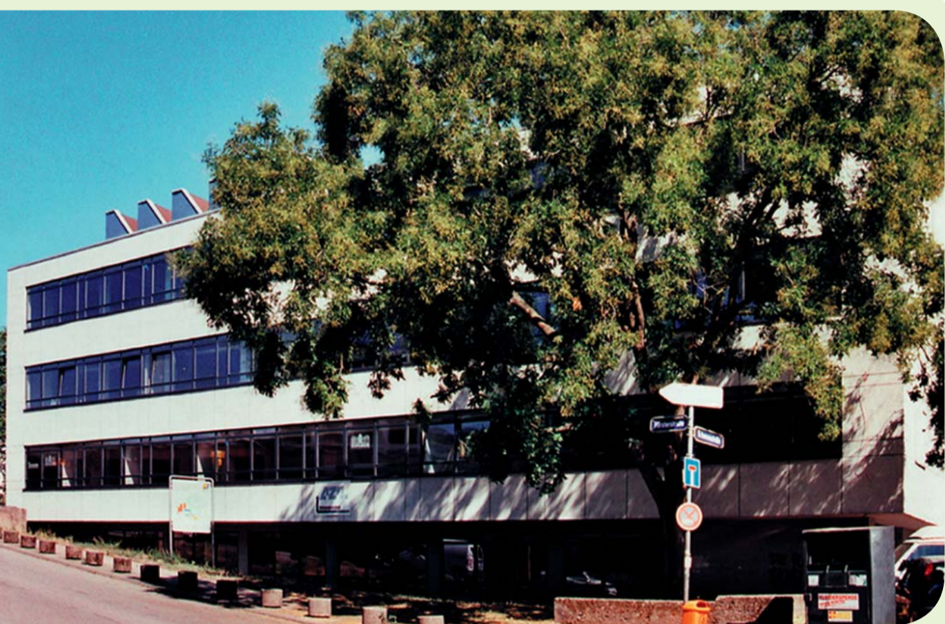
IMZ Informations- und Medienzentrum des RV Saarbrücken

Kooperationsprojekt Gesundheitsamt des Regionalverbandes Saarbrücken mit dem IMZ Informations- und Medienzentrum des Regionalverbandes Saarbrücken