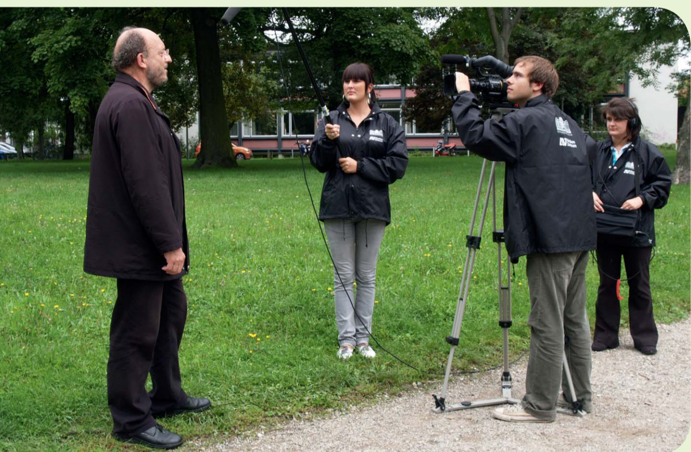
Ausbildungsbetrieb – Mediengestalter Bild und Ton