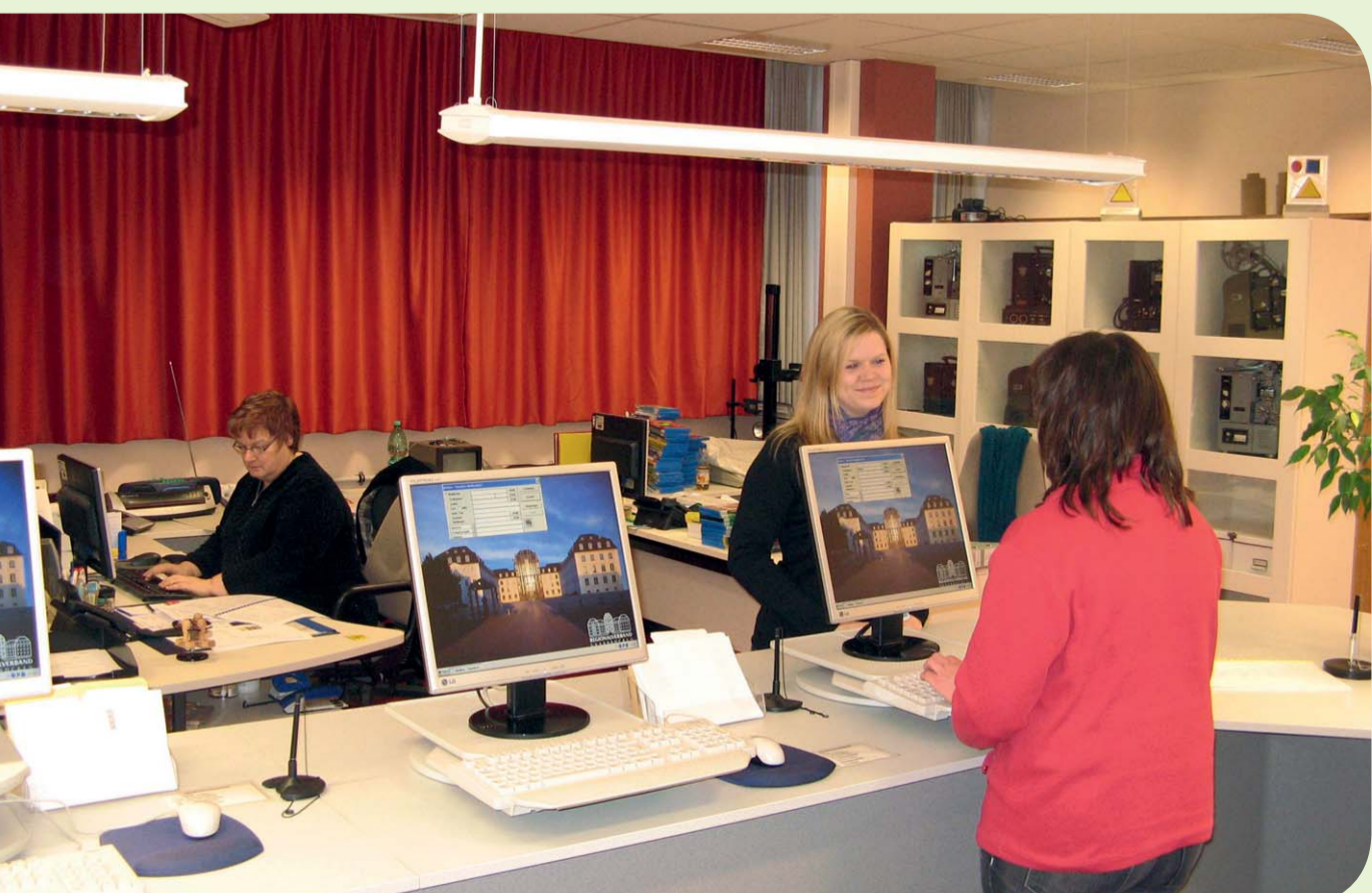
Medienberatung und Ausleihe