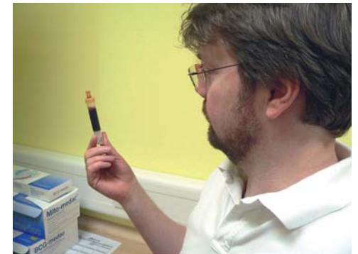
Der PSA-Wert wird über das Blut bestimmt

Die Frage lautet also eigentlich nicht, ob ich den PSA-Wert brauche, sondern ob ich wissen will, dass ich Prostatakrebs habe oder nicht.